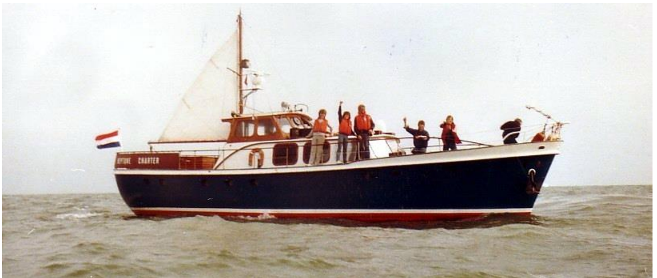
Zilvermeeuw augustus 1983