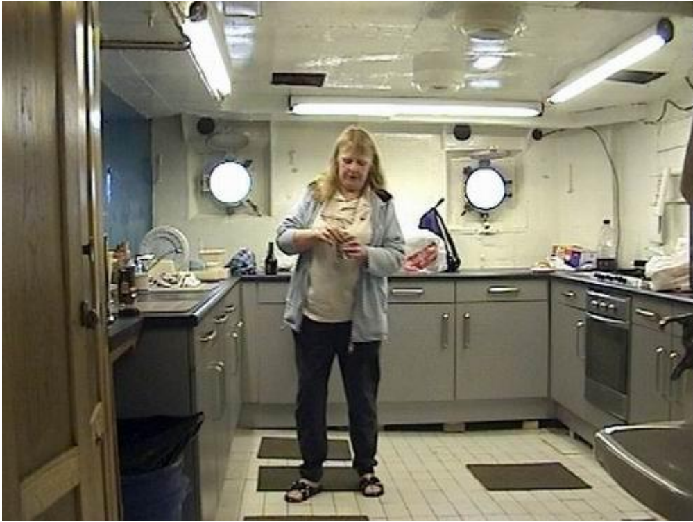
The new kitchen