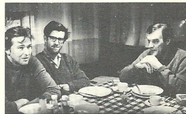
Boven: Wonderful Radio London