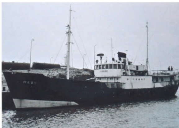
Mebo I 1971.