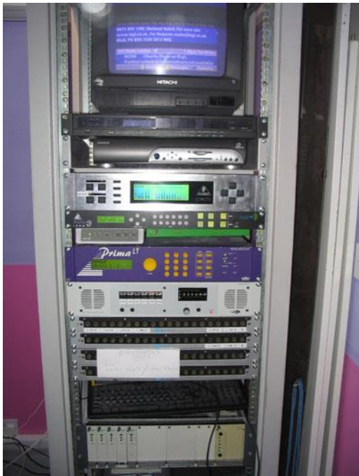
The new Radio London

that day over in London to interview Sir Cliff Richard for a program, probably transmitted around Christmas. It will be a special about all those songs recorded by Cliff way back in the period March 1964-August 1967.