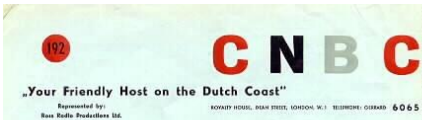
LETTERHEAD (ARCHIVE HANS KNOT)

number of successes in the charts and including the Wheels Cha Cha, I am sure a lot of people will remember that.