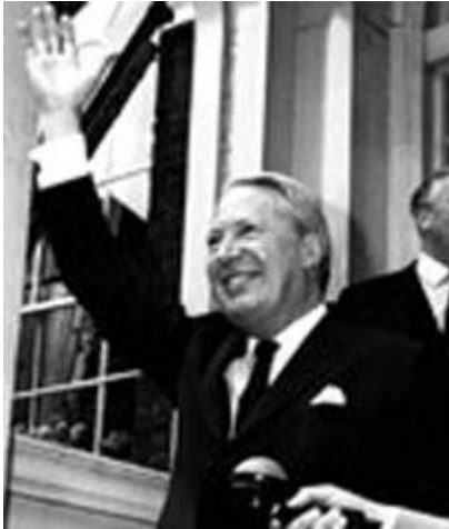
EDWARD HEATH (PHOTO UNKNOWN)

So, we went on for a few months and then during the proceedings we got a telephone call one day from the house of parliament and it was then Edward Heath, who was later to become Prime Minister, rang up and he was employed in the government at that time as the Lord Privy Seal. Now his department wanted to know just how far this pirate radio was going to operate. Was it going to come closer to London, or was the ship going to remain where it was. But certainly the Home Office was becoming very interested in the activities because they suddenly realised that on the horizon not too far away was an alternative form of radio from the then monopolistic BBC. We told him that we had no intentions at that time to bring the ship across because it was Dutch-owned and they wanted Dutch radio but at certain times of the day they thought the market could open up for the English situation.