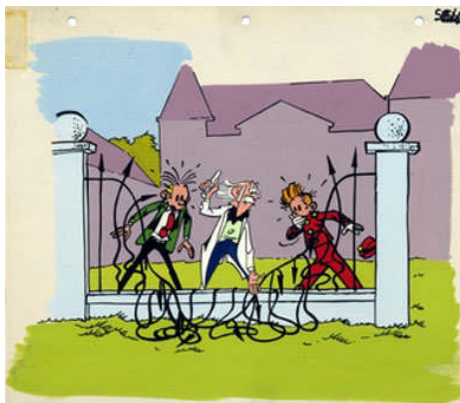
ONNODIGE VERNIELING IN ROBBEDOES

Maar natuurlijk hadden de jongeren in die tijd ook de mogelijkheid zich te vermaken met het lezen en kijken in stripbladen. Zo was er het blad 'Sjors' waarin de nodige gevechten plaats vonden en in bepaalde opvoedkundige kringen werd gezien als een onverantwoord drukwerk vol geweldpleging. Gelukkig stond daar tegenover dat er nog redelijke andere stripbladen waren, waarin meer educatief en spanning werd voorgeschoteld. De Robbedoes en Kris Kras stonden daarbij voorop. Zuur was het dan ook voor de samenstellers van laatst genoemd tijdschrift dat de uitgeverij de stekker eruit trok omdat er veel te weinig belangstelling was voor deze publicatie voor de jeugd.