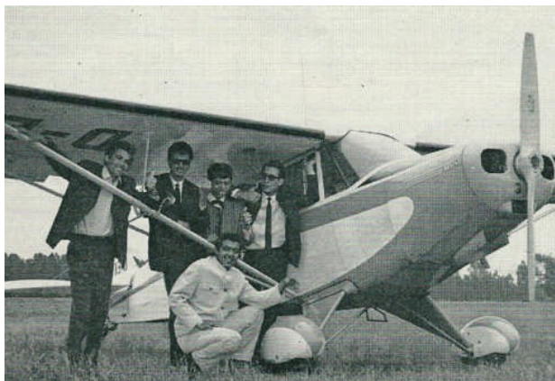
Crazy Rockers

Soms kom je in oude kranten of tijdschriften verhalen tegen waarbij de persoon die het middelpunt vormde, op het moment dat het betreffende artikel werd gepubliceerd, nog helemaal niet bekend was. Zo bladerde ik door het nummer van 'de Wereldkroniek' van 30 januari 1965, waarin veel aandacht voor het overlijden van Sir Winston Churchill, en kwam een artikel tegen waarin aandacht werd besteed aan 'The Crazy Rockers', een indo band uit Den Haag en omgeving. Deze formatie had jaren eerder een hitje gehad in ons land met 'Papa mama twist' Ze traden in 1965 niet veel meer op in Nederland want volgens één van de fans verdienden ze in die tijd veel meer met hun optredens in Duitsland, wel tot 4000 Mark per maand per persoon. Uiteraard dienden daar wel alle kosten nog worden afgetrokken maar voor 1965 een prachtig mooi maandbedrag. Het verhaal werd gedaan door een 18-jarige kantoorbiedende uit Den Haag, die zelf slechts geld had voor het berijden van een fiets. De 'Crazy Rockers hobby' beoefende hij slechts voor zijn plezier: "Toen ik die jongens een paar jaar geleden voor het eerst hoorde dacht ik: dat is het. En ik nam mezelf meteen voor ze in Nederland naar het eerste plan te brengen. De betreffende persoon besloot the 'Crazy Rockers Fanclub' op te richten en maakte vervolgens overal reclame voor 'zijn orkest' en kreeg een platenmaatschappij zelfs zo ver om vier singels en een EP uit te brengen.