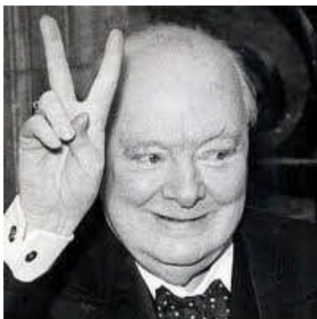
Sir Winston Churchill