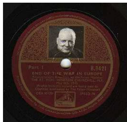
LP met rouwdienst Churchill

Opmerkelijk voor die tijd was het grote aantal Britse burgers dat de laatste eer bracht aan de, op negentigjarige leeftijd overleden, Sir Winston Churchill. Het was de bedoeling dat om 12 uur middernacht Westminster Hall zou worden gesloten, maar de enorme rij, die voorbij trok, deed de autoriteiten besluiten de deuren tot de volgende morgen zes uur open te houden. Naar schatting hebben destijds ruim 350.000 mensen de baar gepasseerd.