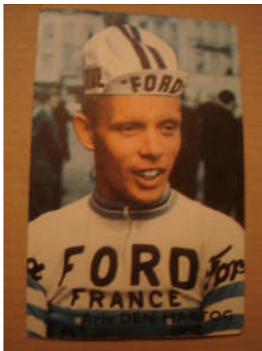
Arie den Hartog: foto Archief Freewave Media Magazine

Als we de plaatsnaam San Remo horen denken we vrijwel direct aan een van de vele wielrenklassiekers die jaarlijks plaatsvinden en wel Milaan - San Remo, een koers die in 1965 werd gewonnen door onze landgenoot Arie den Hartog. Deze toen 23-jarige renner, knecht in de ploeg van Anquetil in het fabrieksteam Ford-Gitane, had de 287 kilometer lange race met een gemiddelde van 41,641 kilometer afgelegd. De 56 ste editie van deze klassieker had vooral in het teken gestaan van een 160 kilometer lange solo van de Belg Rick van Looy, een andere grote naam uit de wielwereld van de jaren zestig van de vorige eeuw. Nadat hij was teruggepakt door het peloton waren er een paar andere pogingen, waarbij Adorni en Balmamion een voorsprong hadden opgebouwd. Ze bleven niet lang alleen, want op 21 kilometer voor de finish besloot Den Hartog weg te springen uit het peloton. Binnen 5 kilometer had hij al een voorsprong van 40 seconden opgebouwd en haalde het tweetal in. Het kwam op een sprint aan, waarbij de Italianen geen kracht meer over hadden om onze landgenoot te verrassen. Jan Jansen werd de tweede Nederlander op de 6 de plaats.