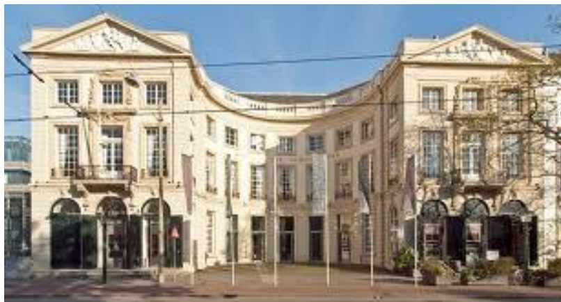
Koninklijke Schouwburg Den Haag

Begin 1963 werd er in het kort stilgestaan bij een onderzoek betreffende het eventuele teruglopen van het aantal bezoekers aan toneelvoorstellingen. Het resultaat van het onderzoek wees uit dat de televisie beslist geen ongunstige invloed uitoefende op het bezoek aan toneelvoorstellingen. Het resultaat was vastgelegd in een verslag uitgegeven in opdracht van de directie van de Koninklijke Schouwburg in Den Haag.