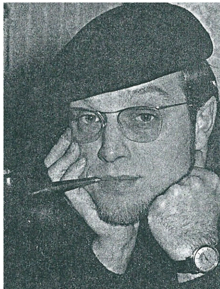
Nand Baert

Nand Baert (1932-1985) was een Vlaams radio- en televisiepresentator. Hij was tijdens de Expo 58 wereldtentoonstelling in Brussel één van de stemmen die voor de Belgische radio vanuit de paviljoenen verslag deed. Hij was ook een bekende presentator bij Radio Luxemburg, onder de naam 'Peter' en Omroep Oost-Vlaanderen. Van 1977 tot 1985 was hij de presentator van de Vlaamse televisiequiz Van Pool tot Evenaar.