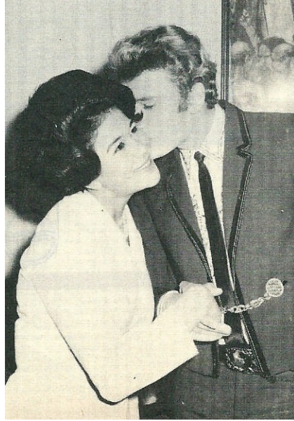
Anneke Grönloh en Johnny Hallyday