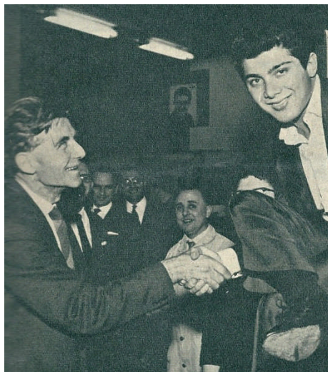
A. Den Doolaard en Paul Anka

Trouwens, de bijeenkomst verliep niet geheel vlekkeloos, een toonbank had het begeven onder het gewicht van de fans. Geen wonder want de toonbanken waren aangeschaft voor de verkoop van 'jongherenkleding' en deden het zeker niet bevredigend als podium! Op die tweede verdieping dus duizenden aanhangers van Paul Anka maar op de parterre was op hetzelfde moment in het filiaal 'L'innovation' in Antwerpen een beroemde Nederlandse schrijver, A. den Doolaard, te gast, die enkele honderden aanwezigen plezierig verhaalde over zijn reizen naar Griekenland, uiteraard met als doel zijn boeken vaak langs de kassa van het warenhuis te laten gaan.