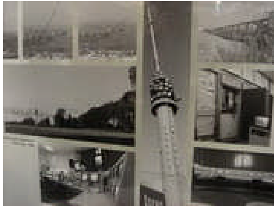
Ansichtkaart Gerbrandy toren

Op 8 mei 1962 werd de mast, met een gewicht van negentig ton, neergehaald. De redactie van 'Nieuws van de dag' meldde in de avondkrant: 'Sinds vanmorgen even over elf telt het park van radio- en televisiemasten één mast minder. Met een aanzwellende dreun, die seconden lang aanhield, smakte de meer dan tweehonderdmeter hoge mast, die van 2 oktober 1951 tot en met 16 januari 1961 televisieprogramma's het land in heeft gestraald, in het grasland.' De nieuwe mast, die al enige tijd in gebruik was, heeft een hoogte van ruim 350 meter en is, tot op de dag van vandaag, nog steeds in gebruik. De oude mast was voor andere doeleinden niet meer bruikbaar en de kwaliteit van de galvanische beschermingslaag was in de loop van de jaren zo achteruit gegaan dat het onderhoud te duur werd. De restanten van de neergehaalde mast werden trouwens opgekocht door een slopersbedrijf uit Utrecht.