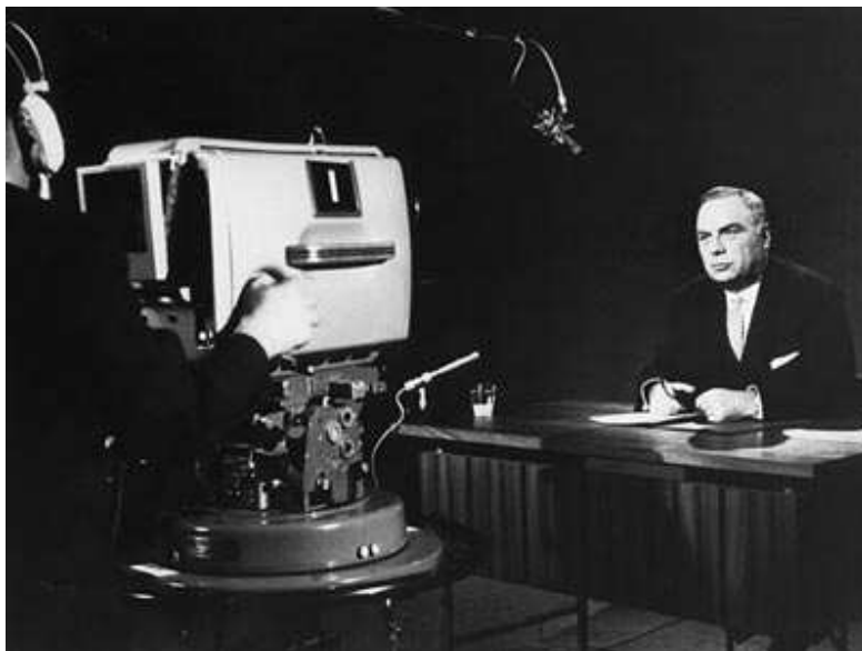
Start ZDF 1964