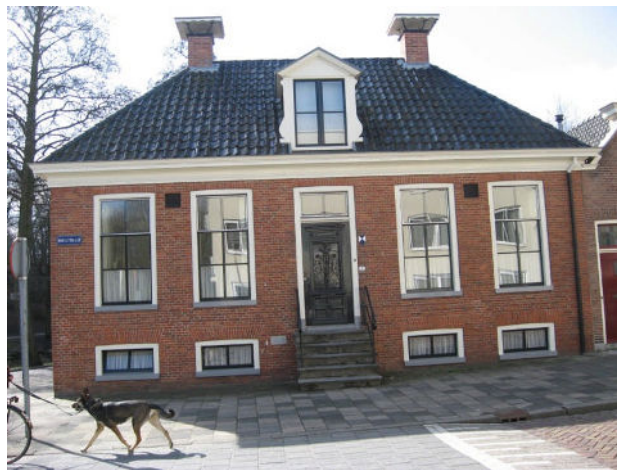
Voormalige politiepost Moesstraat.

Als je goed terugdenkt aan de tijden van weleer is het niet zo abnormaal dat er veel platenzaken waren. Hetzelfde had betrekking op bijvoorbeeld kapperszaken. Volop waren ze er in wat toen nog het Noorden van de stad Groningen werd genoemd. En toch verdienden ze allemaal hun welverdiende brood. Tenslotte een ander voorbeeld, er waren nog echte wachtposten van de gemeente politie in de diverse oude wijken van de stad Groningen. Op weg naar de Katholieke Lagere School St. Ludgerdus gelegen aan de Tuinbouwdwarsstraat, passeerde ikzelf dagelijks minstens twee maal de wachtpost op de hoek van de Noorderbuitensingel en de Moesstraat. Tralies zaten en voor de ramen van het souterrain en dus waren daar de cellen te vinden voor de boeven.