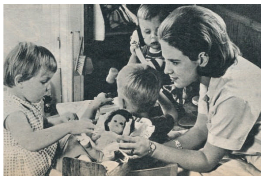
Prinses Anne-Marie van Denemarken

In Griekenland volgde op 6 maart 1964, de op 2 juni 1940 in Psychiko geboren Constatijn II, zijn overleden vader op. Toen hij werd geboren was het nog oorlog en nog geen jaar oud diende hij destijds, samen met zijn ouders, Griekenland te ontvluchten na een Duitse inval. Het werd een zwerftocht want de familie woonde achtereenvolgens in landen Egypte, Zuid Afrika en op Kreta. Een jaar na de vredesondertekening keerde het Griekse Koningsgezin terug naar eigen land om daar vanaf medio 1946 weer te wonen. Constatijn was een echte sportman en trad voor zijn land in de strijd tijdens de Olympische Spelen van 1960, die werden gehouden in het Italiaanse Rome. Hij haalde er goud in de Draakklasse bij het zeilen. Hij huwde op 18 september 1964 met de Deense prinses Anne-Marie. En in die tijd bereidde de vrouw zich als echte 'toekomstige huisvrouw moeder' voor op het huwelijk. Prinses Anne-Marie van Denemarken deed dit door enkele maanden te werken in een kindertehuis in een van de buitenwijken van Kopenhagen.