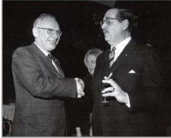
Rengelink en Schüttenhelm Archief Soundscapes

Diegene die zich voor veel geld de mogelijkheid hebben geschapen om de programma's op Nederland 2 te kunnen volgen, voelen zich min of meer bekocht.'