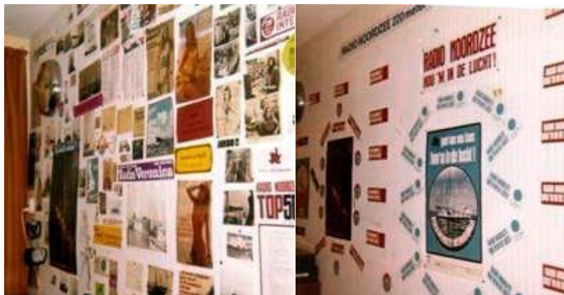
Veronica en Radio Noordzee muur op de radiokamer