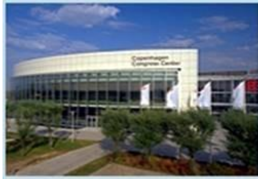
Bella Centre Kopenhagen

het Koninklijk paleis, ik had namelijk tijd zat. Overdag ook maar eens de haven van Kopenhagen ontdekken en 's avonds maar eens de mensen daar leren kennen. Ik liet me door de nachtportier van mijn hotel op de hoogte brengen van wat de buurt aan restaurantjes had en vooral de lokale kroeg aan de rand van de haven werd uitgebreid besproken.