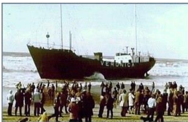
Norderney op het strand