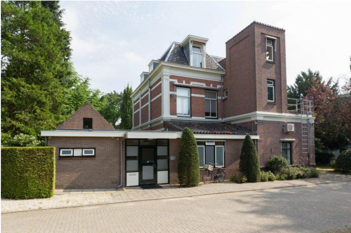
Achterzijde VPRO Villa